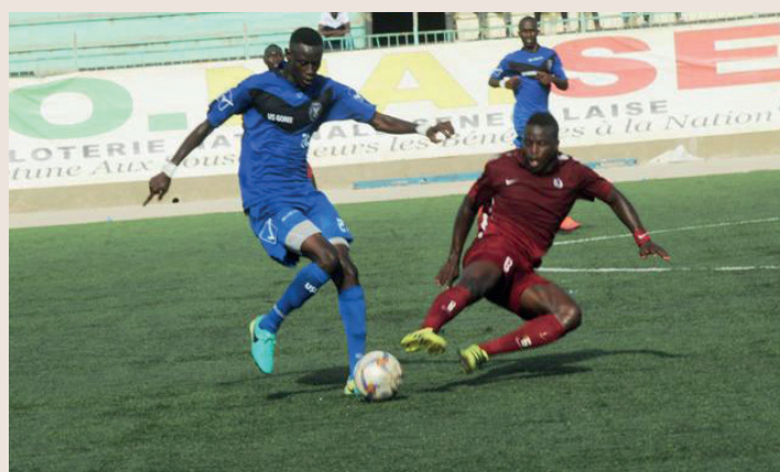
De la détermination de la 1ère à la 90 ème minute

JOURNEE 24 : GENERATION FOOT- STADE MBOUR JOURNEE 25 : AS DOUANE-GENERATION FOOT JOURNEE 26 : GENERATION FOOT- GUEDIAWAYE FC